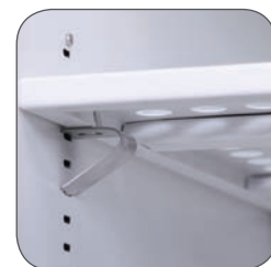
Supports d'étagère inclus