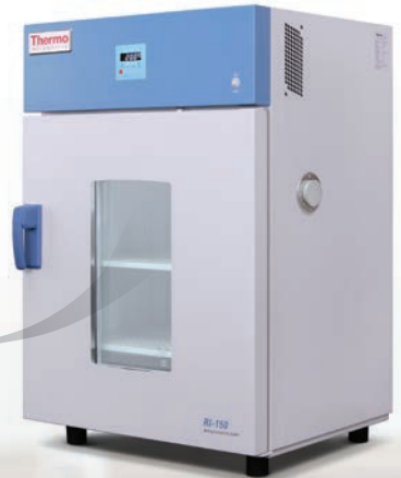
Modèle sur paillasse RI-150

Offrant une plage de températures de 4 à 60°C, nos incubateurs réfrigérés sont conçus pour atteindre les températures d'application précises dont vous avez besoin pour obtenir des résultats reproductibles. Nos incubateurs sont proposés en deux versions : un modèle sur paillasse (RI-150) ou un grand modèle au sol (RI-250).