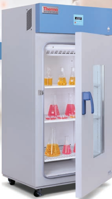
Modèle au sol RI-250